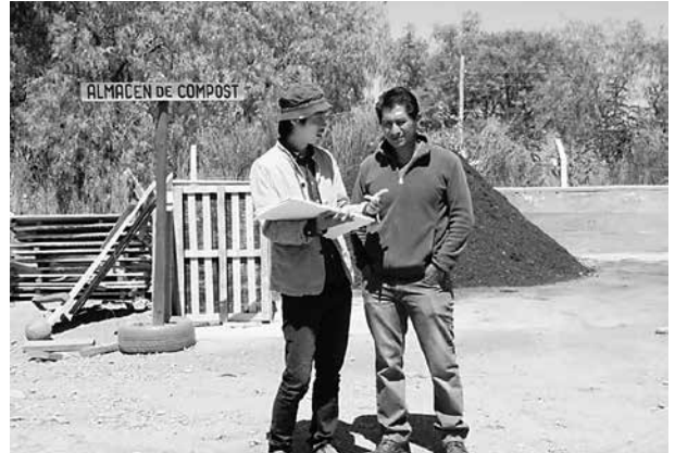
写真9 環境教育担当隊員が携わったコンポスト場