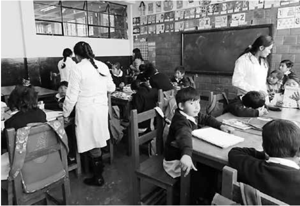
写真11 ラパス市の公立小学校の授業風景