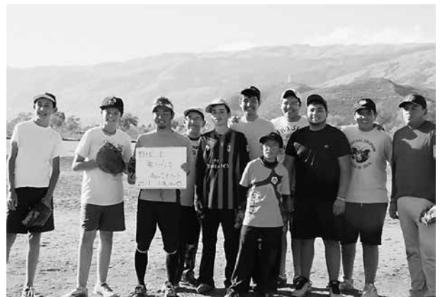
写真10 スポーツ担当隊員と指導を受ける生徒たち