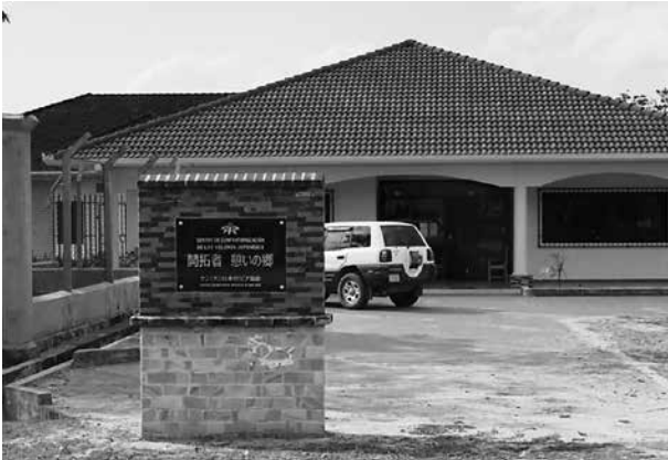
写真7 高齢者福祉施設「開拓者憩いの郷」