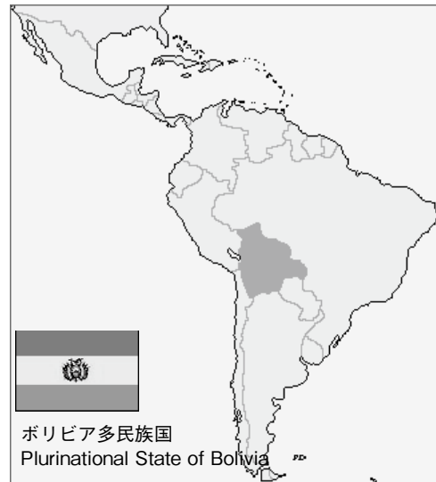
図1 南アメリカ大陸全体図（黒塗り部：ボリビア）

ボリビアは、南アメリカ大陸のほぼ中央部に位置し、ペルー、チリ、アルゼンチン、パラグアイ、ブラジルの5か国に囲まれた内陸国で、国土面積（109,8581km 2 ）は日本の約3倍に相当する（図1）。9つの県で構成される（図2）、地形は標高により3地域に区分されている。標高3000m以上の高原地域（ラパス・オルロ・ポトシ県）は国土の約3分の1近くをアンデス山脈が占め、年間を通じて寒冷である。標高1000～3000mの溪谷地域（コチャバンバ、チュキサカ、タリハ県）は年間を通じて温暖、標高1000m以下の平原地域（サンタ・クルス、ベニ、パンド県）は熱帯・亜熱帯気候であり、熱帯雨林やサバンナが広がる。人口は約1005万人（2014年）、そのうち55%がインディオ（先住民）、32%がメスティソ（混血）、13%が欧州系の人々で構成される。ボリビアの公用語はスペイン語であるが、それ以外に、独自の先住民言語を母語とする先住民が36存在する。色鮮やかな民族