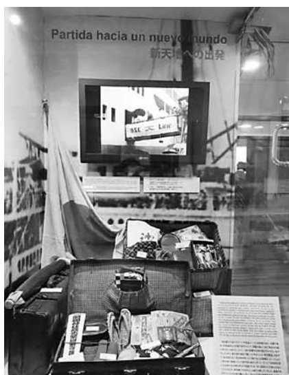
写真2 移住に向けて準備された生活必需品

は、資源外交上の関係を構築する上で重要であり、日本は、「貧困削減のための社会開発支援」、「持続的経済成長のための支援」を基本方針とし、研修員の受入れ、専門家やJICA隊員の派遣、無償資金協力や技術協力等の支援を通して二国間の関係性を築いている。また、110年以上の移住の歴史と1万人を超える日系人の存在が二国間の友好関係促進の基盤になっている。