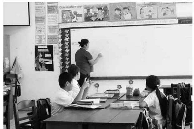
写真6 日本語教育の授業を受けるボリビア人生徒

高齢者福祉担当隊員は日系社会シニアボランティアで、サンファン移住地内にある「開拓者憩いの郷」と称される高齢者福祉施設で活動している（写真7）。この施設は、デイサービス、リハビリテーション、趣味の場として、誰でも利用できるように整備されていた。高齢者福祉担当隊員は、施設全体の企画から運営等を行い、