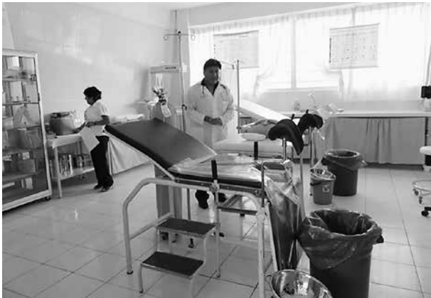
写真4 診療所の分娩室