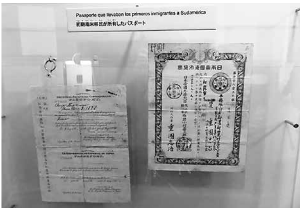
写真1 当時の移住者が所有したパスポート