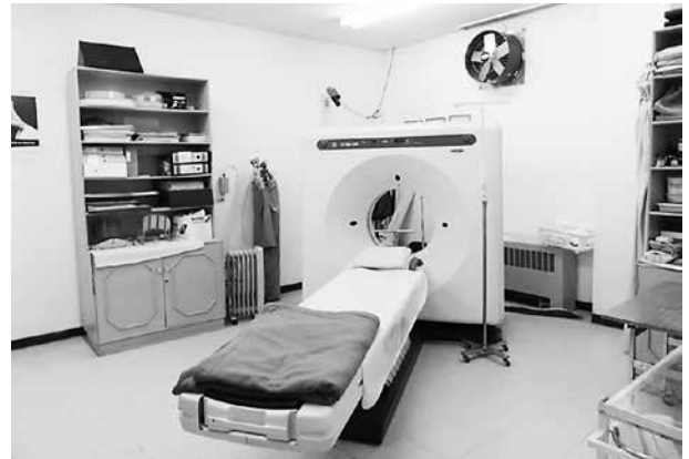
写真13 22年前に日本から提供されたCT

今回の視察先および懇親会で出会ったJICA隊員は、派遣されたばかりの隊員から帰国間近の隊員までいた。異国の地で慣れない生活に苦労しているとの声、少しずつ