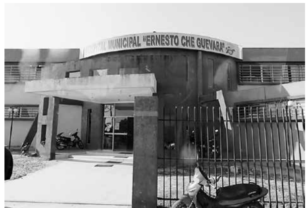
写真3 助産師担当隊員が活動する診療所

ボリビアの妊産婦死亡率は206(出生10万人対)、5歳未満児死亡率は39(1000人対)と推計され、改善されてきているものの、いずれも中南米地域では高い死亡率となっている。また、未成年の出産率も89人(1000人対)と高く 4) 、妊産婦の教育レベルや施設分娩率の低さなどが関連しているといわれている。さらに、保健人材の配置には職種レベルの格差や地域格差がみられ、准看護師の56.1%は一次医療施設で勤務している 5) 。そのため、一次医療施設で勤務する准看護師は、地域・農村部のプライマリーヘルスケアを率先して行う立場にあるが医療知識・技術が十分ではないために適切な保健サービスを提供できていないことも母子保健指標改善の大きな障害となっている。助産師担当隊員の活動先は、一次医療施設であるコミュニケーションレベルの診療所(写真3)である。2012年に設立され2013年には分娩設備(写真4)が整った。この診療所においても、医師(プライマリ・ケア医)6名、正看護師4名、准看護師8名が勤務しており、産科医、小児科医といった専門医や助産師はいなかった。ボリビアの看護師教育課程は3か月の課程から