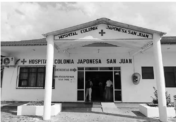
写真8 サンファン診療所