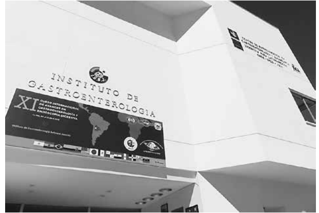
写真12 日本ボリビア消化器疾患研究所

じめ、仕事にやりがいを感じるようになってJICAボランティアへの応募に至っている。「派遣当初は、結果を残すことばかりを考え、上手くいかないことを環境のせいばかりしていた。活動を通して、日本の考え方や価値観で生徒を捉える視野の狭さへの気づきや本当の意味での特別支援は何かを考える機会にもなった。現地の教員が自分の活動に興味をもつようになるまでが大変であり、活動の半分以上は辛かったが、任期終了となりボリビアでの活動をもっと続けたい気持ちである。」と語った。視察時は帰国間近であり、帰国後は海外と繋がった仕事を何か見つけたいとのことであった。